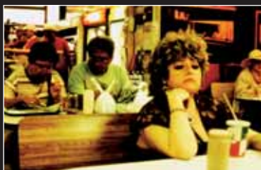
→ Odessa Odessa ... (Israel 2004) Geschichte der ukrainischen Juden, die nach Amerika oder Israel ausgewanderten