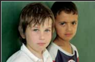
→ Bridge Over the Wadi (Israel 2006): Dokumentarfilm über die erste jüdisch-arabische Schule in einem arabischen Dorf.