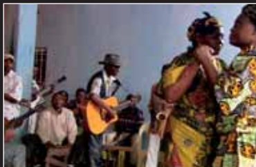
→ Le Batelier de la Rumba - Dokumentarfilm über den Musiker Papa Wendo aus dem Kongo