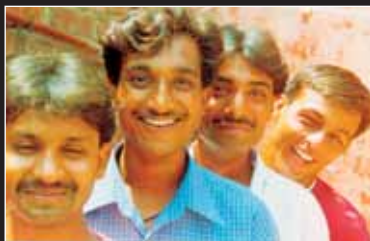
→ When four friends meet - Indischer Dokumentarfilm über ein Arbeiterviertel am Stadtrand von Delhi