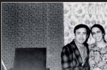
→ We're British but ... (GB 1997-2003) Britisches Kurzfilmprogramm, der unterschiedliche Lebensentwürfe von MigrantInnen in GB behandelt. Das Foto ist von dem Kurzfilm SAFAR