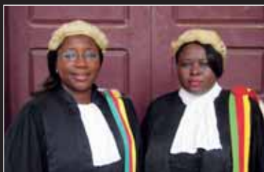
→ Sisters in Law - Dokumentarfilm über Gerichtsverhandlungen in Kamerun