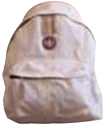
Rucksack 39,90 €, Murphy & Nye Leder-Armband 29,- €, Hugo Boss