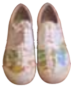
Schuhe 150,- €, Puma Ledergürtel 59,- €, Hugo Boss