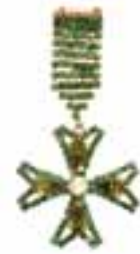
Tasche 199,- €, Escada Brosche 69,90 € String-Tanga 7,95 €, Street One