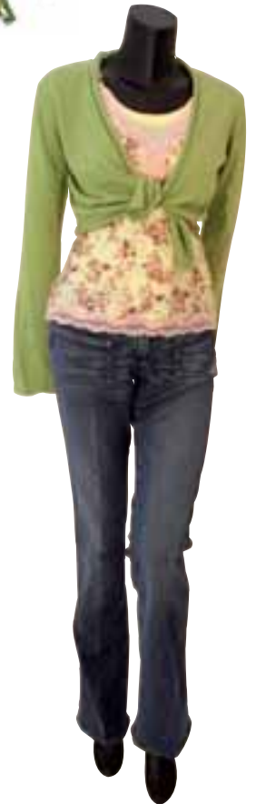
Wickeltop 29,95 €, Street One Blusen-Top 149,- €, Gold Hawk gelbes Top 49,- €, C & C California Jeans 140,- €, Diesel