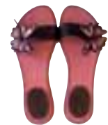
Sandaletten 69,95 €, Miss Sixty Gürtel 79,- €, Hugo Boss Mantel 199,95 €, Daite