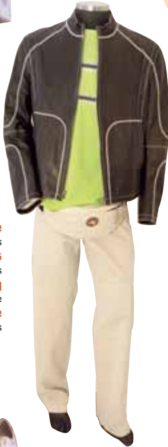
Lederjacke 649,- €, Hugo Boss Sweatshirt 59,- €, Hugo Boss Body-Bag 13,- €, Murphy & Nye Hose 119,- €, Hugo Boss