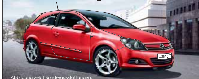
Abbildung zeigt Sonderausstattungen.

Betont dynamisches Design, sportliche Proportionen und ausdrucksstarker Charakter: Der neue Opel Astra GTC Sport, u. a. serienmäßig mit: