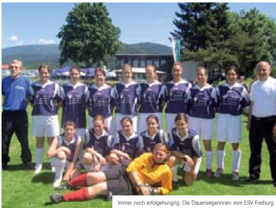
Immer noch erfolgreich: Die Dauersiegerinnen vom ESV Freiburg