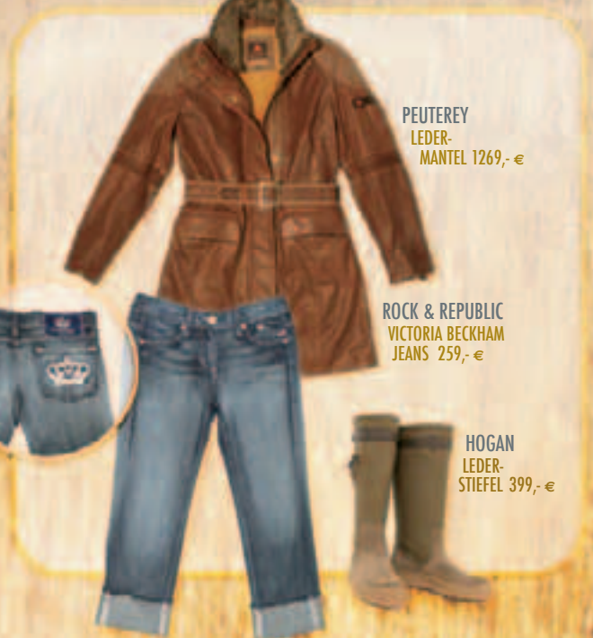
PEUTEREY LEDER- MANTEL 1269,- €