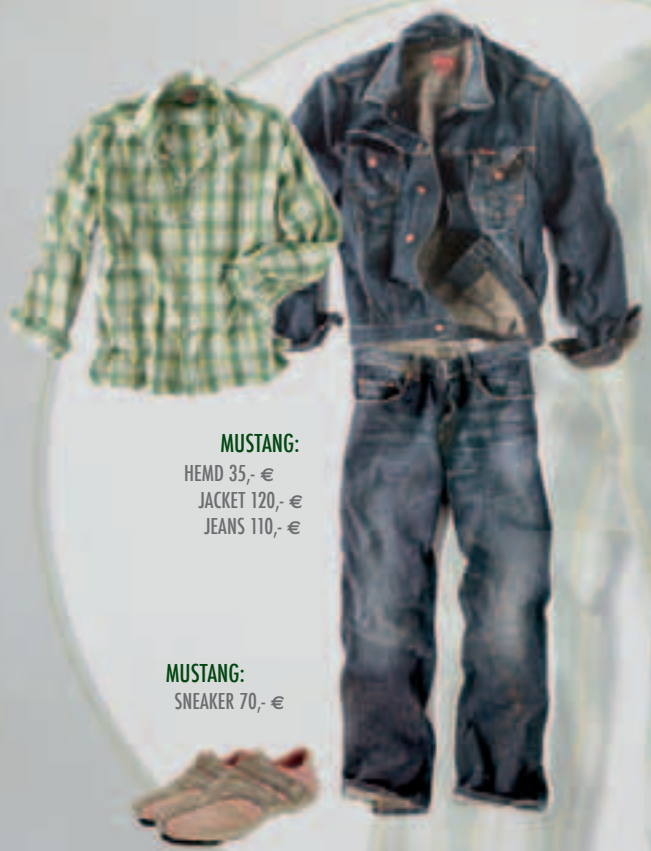
MUSTANG: HEMD 35,- € JACKET 120,- € JEANS 110,- €