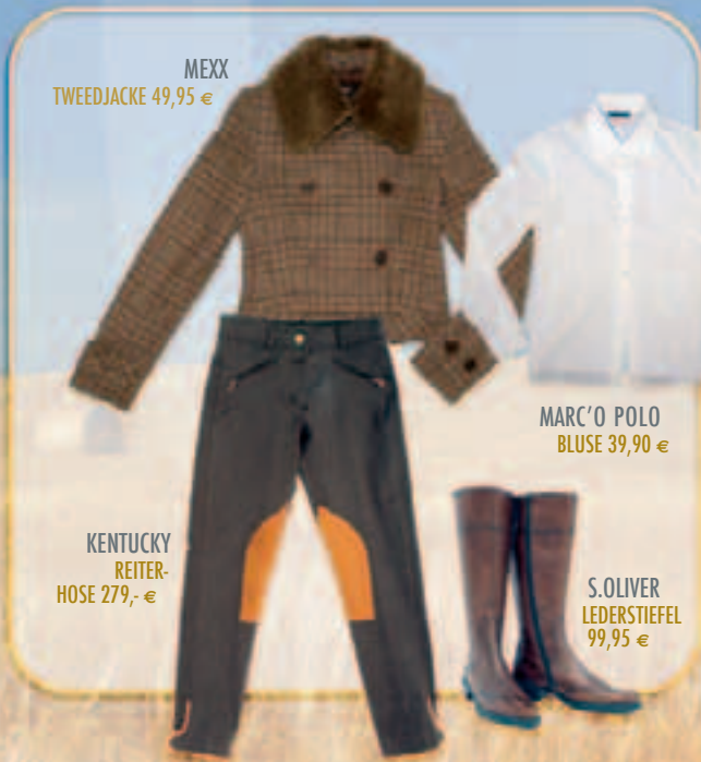
MEXX TWEEDJACKE 49,95 €

Kombiniert werden Brauntöne und dunkle Erdfarben mit hellen, naturfarbenen Outfits. Bekannte Labels wie Mexx, S. Oliver und Esprit mischen auch diesmal wieder mit. Neu und absolut exklusiv ist die Victoria Beckham- Jeans im Sortiment. Der Eyecatcher lässt das Shopping-Herz höher schlagen.