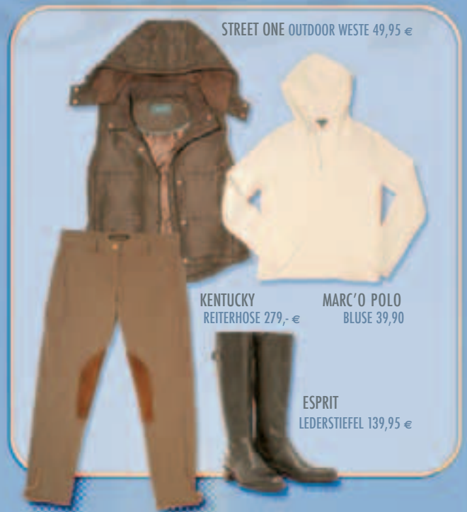
STREET ONE OUTDOOR WESTE 49,95 €

Ledermäntel, Tweedblazer, Stretchjeans, Wollpullis und leichte Baumwollblusen kombiniert mit Accessoires bilden den lässigen Herbstlook bei Kaiser. Auffallende Reiterstiefel sind dabei ein absolutes Must have zum Ensemble.