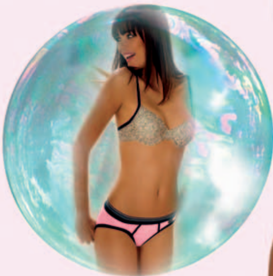
„ Contrasts “ von Schiesser BH 19,95 € Hip Slip 7,95 €

Bei der Serie „ Contrasts “ von Schiesser treffen Coolness und Unbeschwertheit aufeinander. Im Kontrast stehen klare Farbe und sportiver Style mit verspieltem Design und femininer Optik.