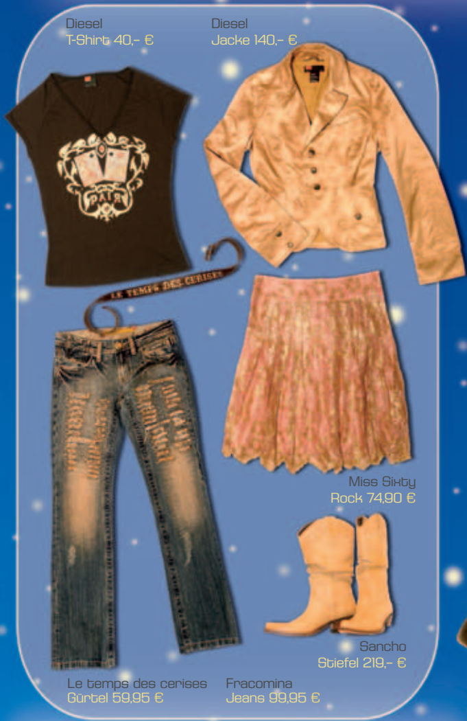
Diesel T-Shirt 40,- €

Für heiße Nächte im Partyrausch ist durchaus etwas mehr Kürze und Luftigkeit angebracht: Das plüschige Blusentop passt hervorragend zur Bermuda-Shorts. Schwarze Stiefel kommen in diesem Look bestens zur Geltung, das Outfit verleiht eine gewisse Boheme-Chic-Aura.