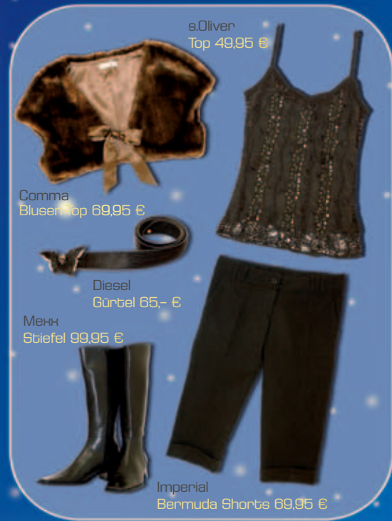
s.Oliver Top 49,95 €

An manchen Tagen und zu bestimmten Anlässen wollen wir uns so richtig in Schale werfen. Dann holen wir unsere traumhaften Kleider, Roben und festlichen Ensembles aus dem Schrank. Damit der glamouröse Auftritt auch bei winterlichen Temperaturen ein voller Erfolg wird, verraten wir, welcher wärmende Begleiter zum Festtags-Outfit passt. Kombinieren ist so einfach und doch so vielseitig: ob Bolero mit Kleid, Glamour-Jacke mit Jeans oder Rock oder Blusen-Top mit Bermuda-Shorts.