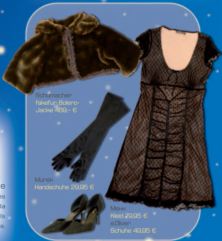
Schumacher fakefur Bolero- Jacke 469,- €

Plüschige Begleiter betonen den fragilen Charme eines zarten Kleides. Tipp: Wer beispielsweise keine dicke Stola oder festlichen Pelz-Mantel im Kleiderschrank hat, wählt als mädchenhaft-glamouröse Alternative eine Bolero-Jacke.