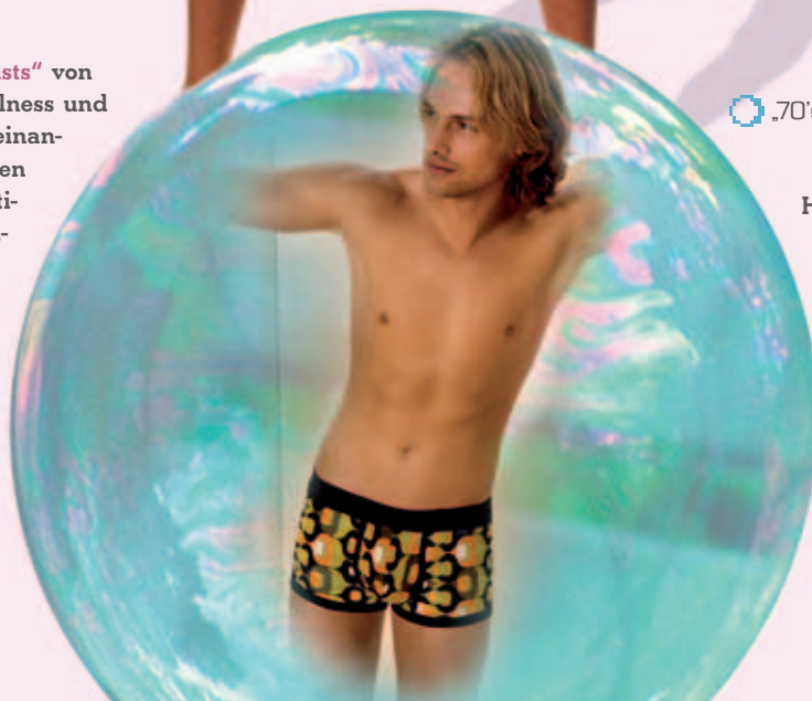
„ 70's Allover “ von Schiesser Shorts € 19,95

Bei der Serie „ Contrasts “ von Schiesser treffen Coolness und Unbeschwertheit aufeinander. Im Kontrast stehen klare Farbe und sportiver Style mit verspieltem Design und femininer Optik.