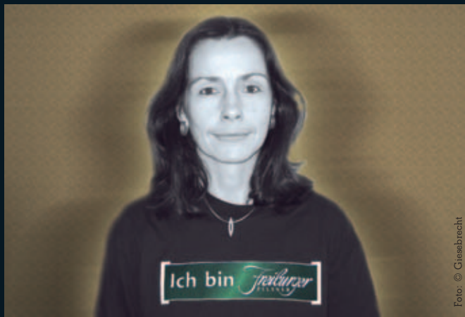
Mit freundlicher Unterstützung der Brauerei Gaanter