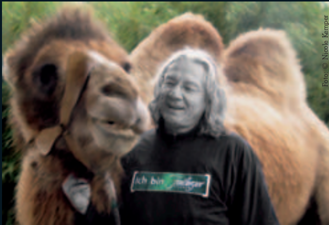
Mit freundlicher Unterstützung der Brauerei Gaanter