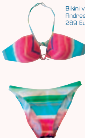
Bikini von Andres Sarda 289 Euro

Ob Triangle-Bikini, gepolsterte Bras oder raffinierte Cutout-Modelle – getragen wird, was gefällt und gut sitzt.