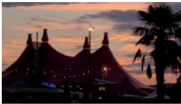
Nachtschwärmers Leidenschaft: Sonnenuntergang auf dem Mundenhof

im ABC-Bauwagen wieder bewährte Veranstaltungen wie den heiß geliebten Bambini-Lauf der Sportgemeinschaft der Sparkasse Freiburg - Nördlicher Breisgau – den der verantwort-