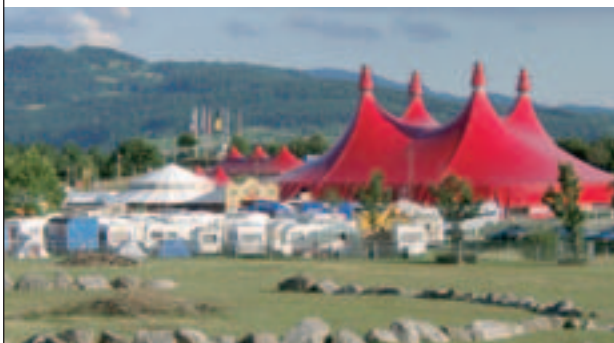
Noch ein tolles Motiv von Klaus Polkowski: Hügellandschaft mit Zeltspitzen

immer, denn der herrliche Platz, tolle Sonnenuntergänge und die Nähe zum Tiergehege haben auch ohne Musik etwas Einmaliges. Lars Bargmann