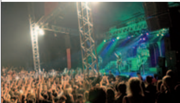
Alice Cooper rockte im Vorjahr – und wurde hiernach heftig gefeiert

schluss meldete Hanusch dann noch die sportliche Umsetzung einer Kult-Idee: Parallel zur Fußball-WM werden in acht Freiburger Kneipen die Vorrundenspiele der Freiburger Stadtmeister-