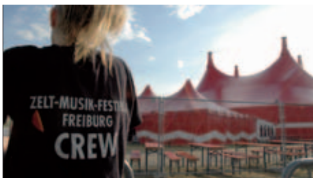
Herzstück des Festivals: Die Crew. Ohne die geht auf dem Mundenhof nichts