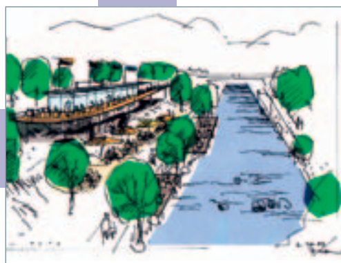
alle Entwürfe: © Bert Wasmer

und klein, dann wieder größer und wurde von Bargmann stetig vorangetrieben. Der gebürtige Bremer rannte von Tiefbauamt zur Hochbauamt, vom Stadtplanungsamt zur Badenova, vom Umweltschutzamt zum Vermessungsamt, zur FWTM, zum Stadtgrün und wieder zurück. „Lars Bargmann war derjenige, der sich festbiss, der sich