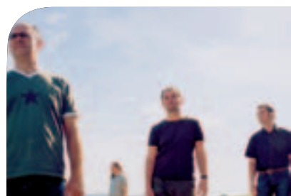
Vom ZMF schon gar nicht mehr wegzudenken – „The Brothers“ bei Freiburger Stimmen