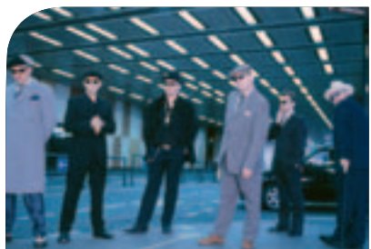
Schweißstreibende Zirkuszeltvorstellung – „Madness“ beim Festivalfinale