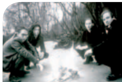
Sie tanzen mit dem Bär – „Liquid Laughter Lounge Quartet“ bei der Europop-Nacht