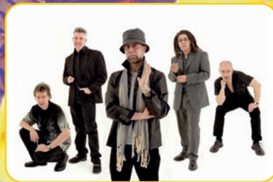
Manfred Mann's Earth Band

Wo sich unterm Jahr sonst die Kurgäste ein lauschiges Plätzchen suchen oder einfach nur herumflanieren, da verwandelt sich Ende Juli der idyllische Kurpark für zwei Wochen in eine coole Open-Air-Location. Auch in diesem Jahr kommen junge und junggebliebene Rockfans wieder voll auf ihre Kosten, denn Manfred Mann, Nazareth und The Blue Van haben sich fürs Festival angesagt.