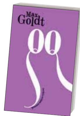
Max Goldt QQ

160 Seiten, Paperback Preis: 17,90 Euro Rowohlt Berlin