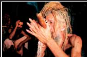
→ Hippie Masala Doku über alternde Blumenkinder in Indien