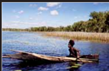
→ 10 Kanus, 150 Speere und drei Frauen der diesjährige Ethno-Film schlechthin

Vom 20. bis 28. Juli findet im Friedrichsbau und im Mensagarten an der Rempartsraße das 4. Freiburger Filmfest statt. Kurz vor dem Start hat sich chilli-Redakteur Georg Giesebrecht mit dem Veranstalter Michael Wiedemann getroffen.