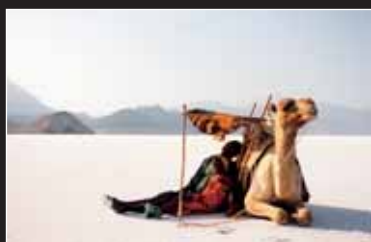
→ Als der Wind den Sand berührte bewegende Flüchtlingsgeschichte ohne Pathos