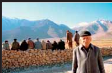
→ Half Moon schwierige Reise eines kurdischen Ensembles