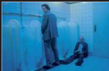
→ Brothersome Man surreale, bitterböse Satire aus Norwegen