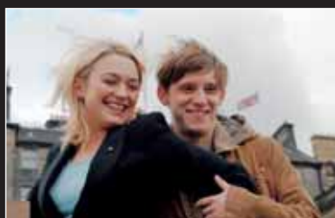
→ Hallam Foe Coming of Age-Story eines reichen Sprösslings