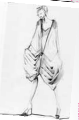
gebracht: Die skizze