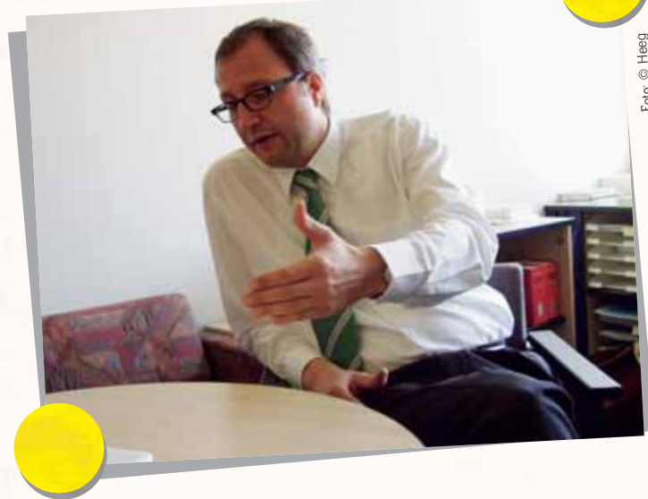
→ Will weiter lehren: Andreas Voßkuhle

chilli: Sie sind 1998 nach Freiburg gekommen. Zufall oder Ziel?