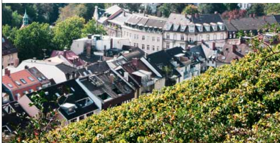
Steil aber fein: in bester Lage, hoch über der Freiburger Altstadt, wachsen die Reben für einen filigranen Weißburgunder.

Münsterplatz 38 | D-79098 Freiburg Tel. 0761/20287-0 | www.alte-wache.com