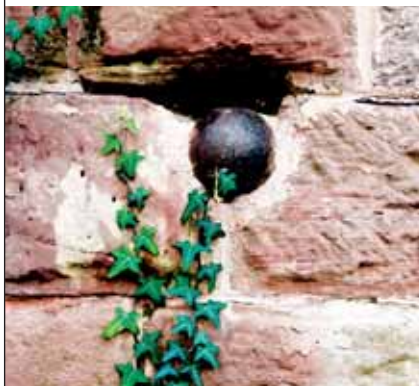
Kanonenkugel in Kapelle:

Mann starken Armee vorbeischaute. Und wieder blieben nur Ruinen. 1677 wurde Freiburg französisch und blieb es bis 1697. König Ludwig XIV. ließ durch Sébastien de Vauban die Stadt als eine Festung gegen das Heilige Römische Reich ausbauen, wofür sein Baumeister auch die Trümmer der südlichen Vorstadt verwendete. An Frieden war damals nicht zu denken: 1703 kamen die französischen Husaren erneut, 1713 im Zuge des spanischen Erbfolgekrieges rückten die Franzosen wieder an und „erwählten sich die Festung Freiburg zum Schießobjekt“. Pfarrer Jung: „Auch dieser Kelch mit aller Bitternis