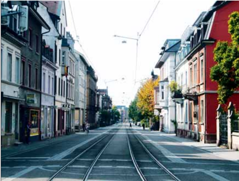
Einer der neueren Kämpfe in der tausendjährigen Geschichte des Stadtteils galt der Basler Straße zwischen Kronenstraße und Johanniskirche, die jetzt nur noch den Trams und Fahrrädern vorbehalten ist – weswegen sich nun die Autoschlängen durch die Lorettostraße schlängeln.

Frieden, Nonchalance, ein „savoir vivre“, wie man es gerne den mediterranen Ländern zuschreibt. Die Kinder auf dem Spielplatz heißen Leon oder Lena und sind in der Regel etwas artiger als anderswo. Einen Steinwurf weiter, vor dem alten Wiehrebahnhof, der in den 30er Jahren des vergangenen Jahrhunderts mit der Verlegung der Trasse der Höllentalbahn nach Süden als Bahnhof ausgedient hatte und Anfang der 70er Jahre in ein kommunales Kino und Kulturzentrum umgewandelt wurde, findet der Öko-Markt statt oder es wird Boule gespielt. Ganz entspannt.