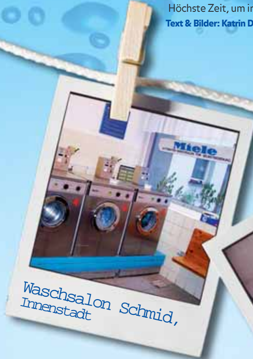
Waschsalon Schmid, Innenstadt

Text & Bilder: Katrin Dreher und Christine Dehez / Collage: Felix Thatenhorst