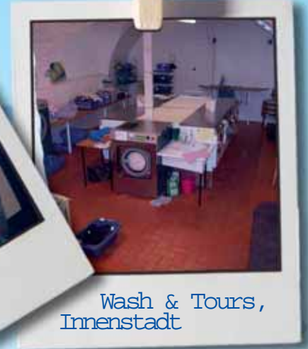
Wash & Tours, Innenstadt

Dazu das Versprechen neben dem Eingang: „Wir garantieren saubere, hygienische und korrekte preiswerte Arbeit.“