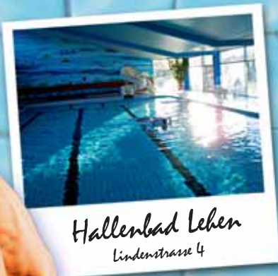
Hallenbad Lehen Lindenstrasse 4

Ist es eine Schwimmhalle? Oder ein Swimmingpool? Das einzige Becken, über das das Hallenbad verfügt, misst gerade einmal 16,67 Meter. Der Vorteil: Angst vorm Untergehen muss fast keiner haben, da das Wasser maximal 1,70 Meter tief ist. Verständlich also, dass sich im Lehener Hallenbad vor allem Kinder tummeln, denen die Schlangenrutsche am Ende des „Pools“ Spaß macht. Auch sonst ist die Atmosphäre familiär: Der Bademeister drückt dem Schwimmer persönlich die Chips für den Spind in die Hand, nach ein paar Minuten kennt man sich.