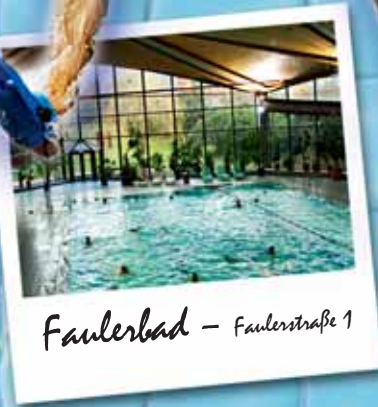
Faulerbad – Faulerstraße 1