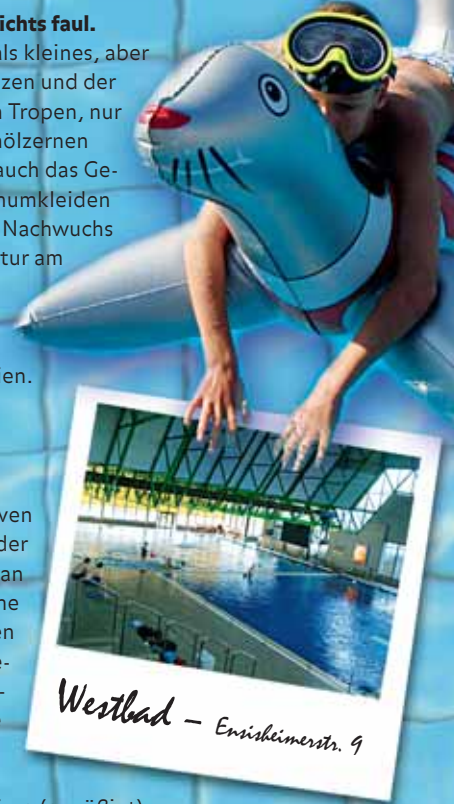
Westbad – Emiskheimerstr. 9

Der kalte Krieg wird wieder lebendig! Nach dem Eintreten geht's die Treppe runter in die massiven Betonkatakomben, genannt: Umkleidekabinen. Auch das Schwimmbecken sitzt fest im Griff der Stahl-Beton-Zange; Rückenschwimmer blicken auf grüne Stahlträger, während eine Digitaluhr an der Wand die exakte Zeit verrät. Dazu Videoüberwachung bei den Spinden und knackige Sprüche am grauen Putz: „Bitte waschen Sie sich!“ vor der Dusche und „Nur für geübte Springer!“ an den Sprungtürmen. Und die machen den architektonischen Graus sofort wieder wett. Zur Wahl stehen: 1 Meter, 3 Meter, 5 Meter, 7,5 Meter und mutige 10 Meter (Bauchklatscher nicht empfehlenswert!). Für alle, die es nicht ganz so hoch möchten, bieten sich die Startblöcke am Rande des 50-Meter-Beckens an. Um vom Nervenkitzel wieder runterzukommen, empfiehlt sich ein Besuch in einem der vier Whirlpools (Zusatzkosten: 1 Euro), von denen einer derzeit defekt ist.