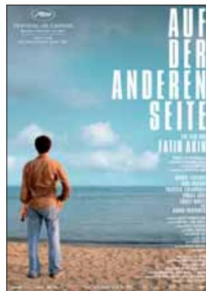
Vier der erfolgreichsten Programmkinoschlangenverursacher aus dem Friedrichsbau-Repertoire des vergangenen Jahres.