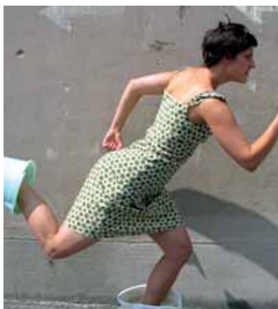
62 CHILLI MÄRZ 2008