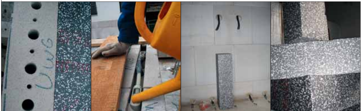
Die Lochkanäle für Heizung und Elektrik werden später mit Quarzsand verfüllt, die Steine für die Außenwände werden gleich samt Dämmung auf die Baustelle geliefert.