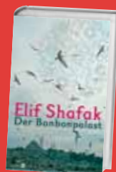
Elif Shafak Der Bonbonpalast 450 Seiten, gebunden Eichborn 2008 24,95 Euro

Osman schickt Briefe an seinen Onkel in Anatolien. Er erklärt ihm, was er so in Deutschland treibt und wie die Leute hier ticken und das in einer Sprache, die hinter ihrer scheinbaren Naivität mit viel Humor gespickt ihren eigentlichen satirischen Charakter enthüllt.