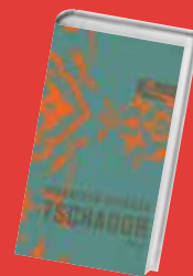
Murathan Mungan Tschador 128 Seiten, gebunden Blumenbar 2008 17,90 Euro

Ein Haus in Istanbul, das seine besten Tage schon hinter sich hat. Darin leben zehn Parteien, darunter auch die Ich-Erzählerin. Es geht drunter und drüber in dem Bonbonpalast, einem lebensnahen Roman, in dem es nur so von miteinander verwobenen Geschichten wimmelt.