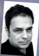
7. August Martin Gülich Helden

Endo Anaconda schreibt über die unendliche Schwierigkeit der menschlichen Existenz – vor allem der eigenen. Seine Kolumnen sind Milieustudien über das Mittelmaß, über den Untergrund der Dienstleister, über Leute, die ihr Schicksal bejammern, sich besaufen und dann vom eigenen Hund in den Hintern gebissen werden.