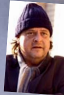
15. August Endo Anaconda Sofareisen und aktuelles ...