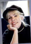
1. August Petra Gabriel Alemannischer Totentanz