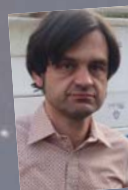
28. August Ralf Welteroth Unter Eselsbrücken Geschichten

Vom tollen Sex der anderen will niemand wirklich was wissen. Dann schon lieber von den Katastrophen, Pannen und Fehlgriffen. Volker Surmann hat Autorinnen und Autoren aus der deutschen Lesebühnen-, Poetry Slam-, Comedy- und Kabarett-szene dazu geführt, ihm ihre miesesten Erlebnisse leselustvoll zu schildern.