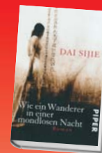
Dai Sijie Wie ein Wanderer in einer mondlosen Nacht 320 Seiten, gebunden Piper, 2009 19,95 Euro

Peking vor 20 Jahren: Vor dem Hintergrund der Studentenunruhen und dem Massaker auf dem Platz des himmlischen Friedens versuchen der Comiczeichner Dawei und sein sprechender Kater ihre Lebenswege zu finden. Kater Haohao treibt die große Sehnsucht, ein Hollywoodstar zu werden ... Ein bizarrer Mix aus geschichtlichen Fakten, Roman und Comicstrip.