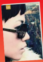
Mian Mian Panda Sex 160 Seiten, Taschenbuch Kiepenheuer & Witsch, 2009 7,95 Euro

lagsproduktion erscheinenden Titel werden im Oktober in einer großen Buchausstellung mit dem Titel „Books on China“ im Forum zu sehen und zu lesen sein. Der Auftritt auf der Frankfurter Buchmesse ist nicht nur ein Glücksfall für die chinesischen Literaten, sondern vor allem auch für die deutschsprachigen Leser. „Über die Literatur können wir ein China kennenlernen, das sich aus vielen Stimmen zusammensetzt und überraschende Antworten geben kann. Wir brauchen dazu nur Neugier und den Mut, Fragen zu stellen“, so Juergen Boos, Direktor der Frankfurter Buchmesse. Chilli-Autorin Nicole Kemper war neugierig und stellt drei ihrer China-Favoriten kurz vor.