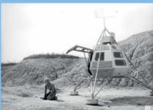
Im Staub der Sterne DDR 1976

Der Arzt Valery Polyakov verbrachte die bisherige Rekordzeit von 438 Tagen im All und trat damit den Beweis an, dass ein bemannter Marsflug möglich ist. Aber der unermüdliche Forscher und Entwickler ist auch ein brillanter Erzähler, der in diesem Porträt tiefe Einblicke in das Seelenleben eines einsamen Raumfahrers gewährt.