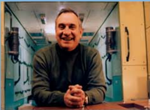
Cosmonaut Polyakov BRD 2007

Der Arzt Valery Polyakov verbrachte die bisherige Rekordzeit von 438 Tagen im All und trat damit den Beweis an, dass ein bemannter Marsflug möglich ist. Aber der unermüdliche Forscher und Entwickler ist auch ein brillanter Erzähler, der in diesem Porträt tiefe Einblicke in das Seelenleben eines einsamen Raumfahrers gewährt.