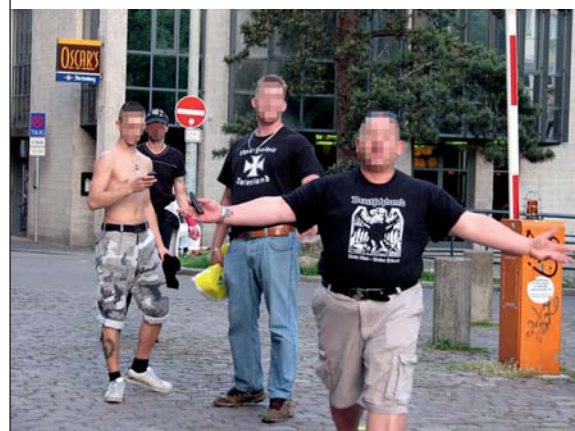
Keine große Lust, fotografiert zu werden: Rechte Typen am Rand der Freiburger Innenstadt.

Noch mehr Arbeit als dem Staatsanwalt bescherte die linke Szene in den vergangenen Wochen der Freiburger Polizei: „Freiburg ist die Hauptstadt der unangemeldeten Demonstrationen“, sagt Hackenjös. „Überall in Deutschland werden Demos angemeldet, nur in Freiburg nicht“, sagt Polizeisprecher Ulrich Brecht. Die linke Szene fände viele Anlässe, um auf sich aufmerksam zu machen. Demos gab es unlängst nach dem Urteil des Verwaltungsgerichtshofs gegen die Schattenparker, >>>