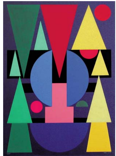
Neben Werken von Vasarely (ganz oben, links und mittleres Bild) werden in Riegel auch Werke aus seinem geistigen Umfeld gezeigt, wie zum Beispiel von Auguste Herbin (oben) und Jean Gorin.