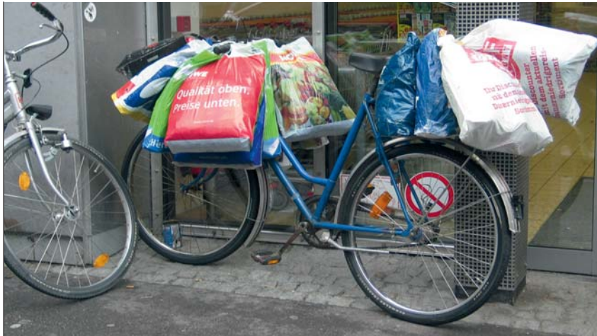
Sichtbar im Stadtbild: Die meisten Wohnungslosen leben in Freiburg aber versteckt.