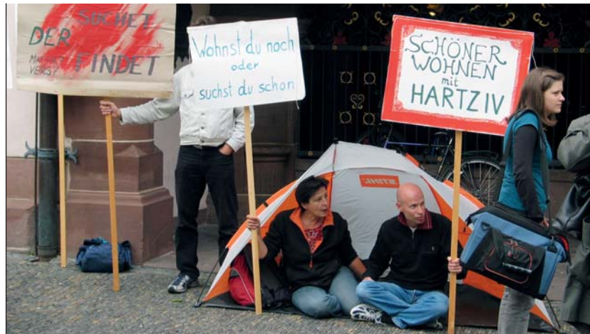
Demo vor dem Rathaus: Seit Hartz IV schlittern deutlich mehr Jugendliche ins Leben auf der Straße, kritisieren nicht nur Freiburger Sozialpädagogen.

Eine Anlaufstation für Obdachlose ist das Ferdinand-Weiß-Haus der Diakonie Freiburg. Um acht Uhr morgens laufen hier die ersten Besucher ein. Nach und nach werden die Vierertische mit den rosa Plastiktischdecken besetzt, jeder Neuankommende sucht sich wenn möglich einen freien Tisch. Das preiswerte Frühstück wird bevorzugt alleine und schweigend eingenommen. Der Morgen ist