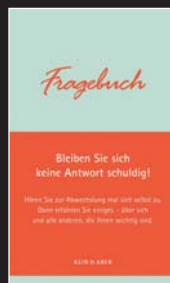
M. Krogerus, R. Tschäppeler Fragebuch 176 Seiten, Kein & Aber 2009 Preis: 16,90 Euro

Dieses Buch gibt keine Antworten, sondern provoziert sie: Die Autoren haben 565 persönliche Fragen gesammelt, die einem normalerweise immer erst hinterher einfallen. Zum Nachdenken, Selberfragen, als Small-Talk-Aufpepper oder Eisbrecher beim Blinddate. Ein kurzweiliges Zwischendurch-Gedankenspiel-Häppchen.