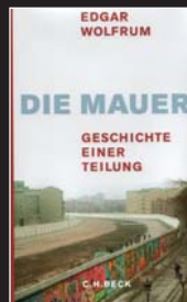
Edgar Wolfrum Die Mauer 192 Seiten, C. H. Beck 2009 Preis: 16,90 Euro

Im stilistischen Mix aus Reportage und Essay spricht der Zeitgeschichtler die bewegenden Fragen der Teilungsgeschichte an. Die greifbare Schilderung der Mauer-Absurditäten entfaltet ihre bedrückende Wirkung und stimmt nachdenklich.