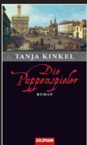
Tanja Kinkel Die Puppenspieler 672 Seiten, Goldmann Preis: 7,00 Euro

In einen wunderbaren historischen Roman verpackt erzählt Tanja Kinkel die Geschichte des jungen Richard Artzt, der zusehen muss, wie seine Mutter als Hexe auf dem Scheiterhaufen verbrannt wird. Seine Reise führt ihn bis nach Florenz, wo er endlich die Möglichkeit bekommt, sein Trauma zu verarbeiten.