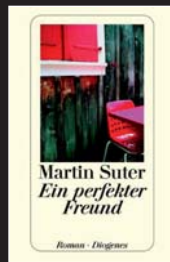
Martin Suter Ein perfekter Freund 352 Seiten, Diogenes Preis: 9,90 Euro

Bereits 2003 erhielt Suter für diesen Krimi, in dem zunächst kein Mord geschieht, den deutschen Krimipreis. Auch 2009 ist die Geschichte aufgrund der gefühlten Nähe vom Leser zum Geschehen noch super-spannend. Empfehlenswert für alle, die gerne beim Lesen Kopfpuzzle spielen.