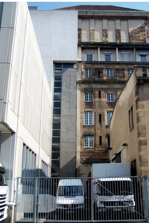
... aber da könnte es Platz haben, das Literaturhaus.