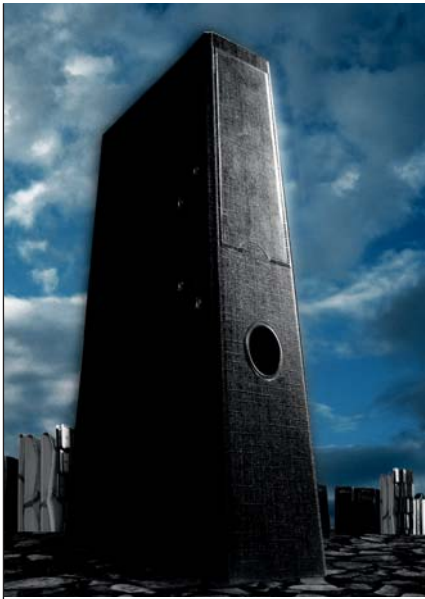
... und hier in der Variante Leni Riefenstahl mit der typischen, glorifizierenden Überhöhung.