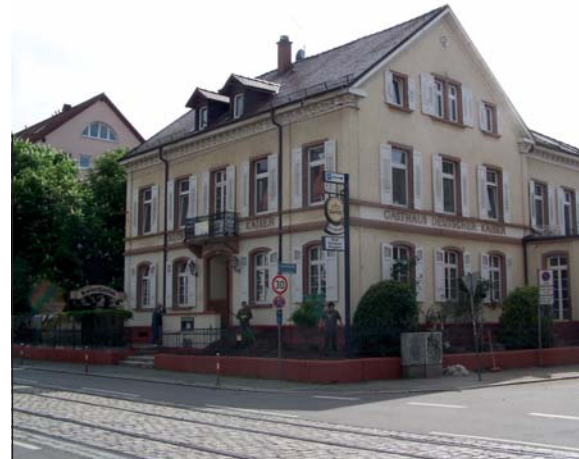
... auch diese Option wurde wieder verworfen ...