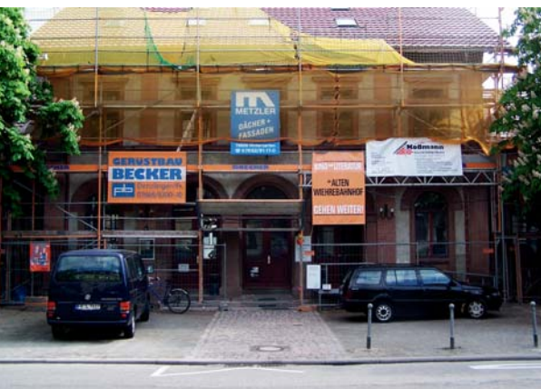
Am jetzigen Standort war es schon länger eng ...