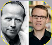
Reiß liest ... Samstag, 7. August

Testdieb Schlaicher braucht Urlaub, aber das Geld dafür fehlt. Da kommt ihm ein Auftrag in den USA gelegen. Doch nachdem der alemannische Indianer „Schwebender Falke“ im Grand Canyon abstürzt, geht es wieder zurück nach Südbaden, wo es Kommissar Schlageter mit den Tücken der späten Liebe und Basset Dr. Watson mit einer bissigen Pudeldame zu tun bekommt.