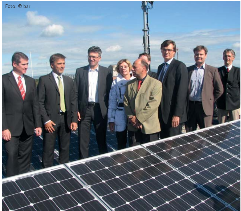
Klimaschutz trifft Rendite: Das neue Sonnenkraftwerk auf den fünf Dächern der ASF entlastet die Umwelt und wirft jährlich 18.000 Euro ab.