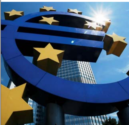
Ein stabiler Euro ist eines der wichtigsten Ziele der neuen Finanzmarktregulierungen: Der hier vorm Eurotower der EZB in Frankfurt steht bisher stabil.

Aus Regierungskreisen hieß es zur Begründung, Sparkassen oder Volksbanken könnten ja vielleicht bei der nächsten Krise mitschuldig sein, des-