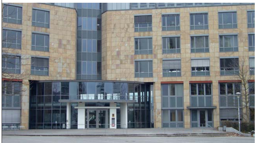
Arbeitsagentur Freiburg – „Die Kurzarbeit hat in nie dagewesener Weise Arbeitslosigkeit verhindert.“