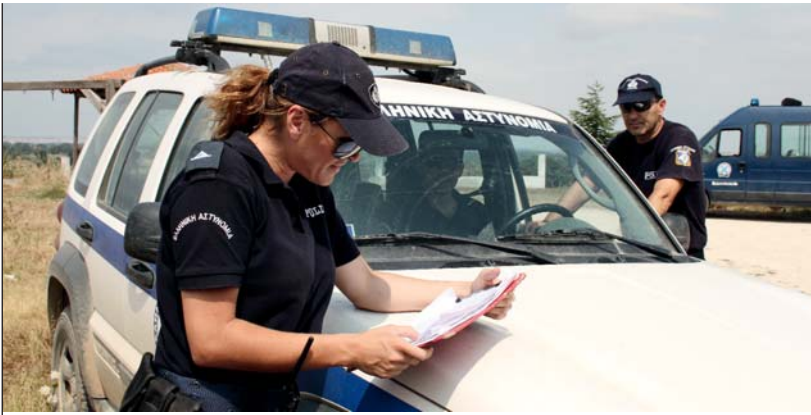
Grenzpatrouille: Im blauen Kleinbus werden erappte Einwanderer gesammelt.

chilli: Also stimmt die bekannte These des amerikanischen Politologen Samuel Huntington, der einen „Clash of Civilizations“ zwischen der westlichen Welt und dem Islam heraufbeschwört?