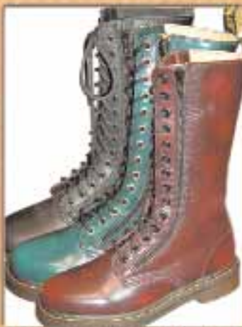
BLACK, TEAL & RED 37-42 ... 139,90

ullbara Ka-Jo 256 / am Martinsort 79095 Freiburg / 07 61-2 92 27 50