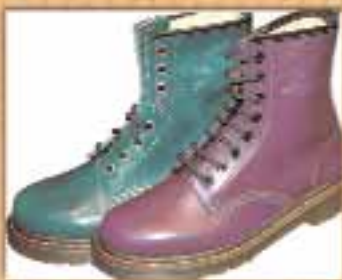
TEAL & PURPLE 37-42 ... 109,90