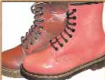
RED & PINK 37-42 ... 109,90