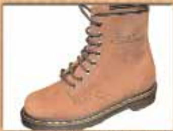
PEANUT 37-42 ... 109,90